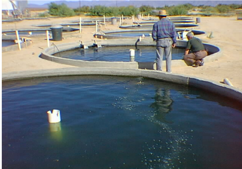
Figura 8: Sistema Deckel em Israel

nitrogenados e incorporação de microorganismos na água. Sendo assim, a área dispensada ao tratamento da água nesse sistema é maior que aquela encontrada em um sistema de recirculação completa, devendo ser instalada em áreas rurais ou de maior tamanho. Essa forma de recirculação é muito trabalhada em Israel (Fig. 8) e, atualmente, nos EUA.