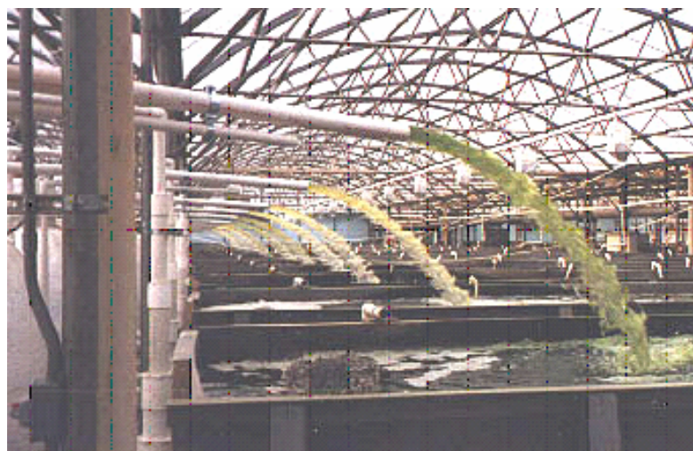
Figura 7: Sistema de recirculação em águas verdes (Deckel)

A recirculação verde, ou sistema Deckel , é assim chamada porque o tratamento biológico da água é realizado em lagoas de tratamento a céu aberto, o que conseqüentemente demanda maiores áreas. Isso ocasiona uma grande proliferação de microorganismos (produção primária), tornando característica a água com a coloração verde (Fig.7). Esse plâncton pode ser utilizado como fonte de alimento vivo para os peixes.