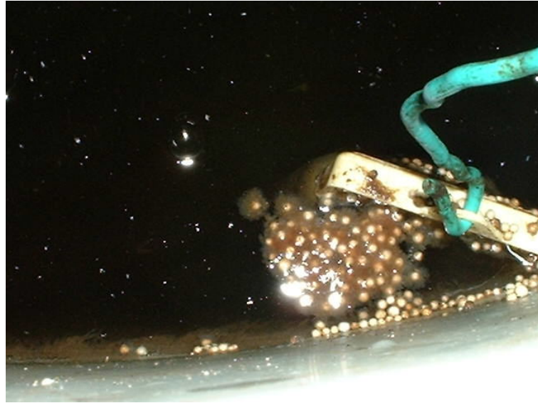
Figura 6: Colônias de bactérias autotróficas aderidas a pérolas de isopor

A fim de evitar a introdução de patógenos ao sistema, a água de abastecimento (água nova) deve ser filtrada, para retenção de partículas, e depois esterilizada. Com o mesmo objetivo, é imprescindível que se faça quarentena e tratamentos profiláticos em todo peixe a ser introduzido na recirculação.