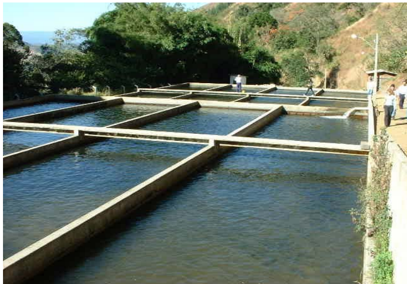
Figura 11: Sistemas de fluxo contínuo ( Raceway ) em tanques retangulares.

A quantidade de entrada de água deve ser suficiente para promover a limpeza rápida dos tanques com máxima retirada de catabólitos, sem, contudo, exigir dos peixes um esforço exagerado para a natação, o que é extremamente desfavorável para seu pleno desenvolvimento, uma vez que a energia que seria usada para seu crescimento estará direcionada para o exercício.