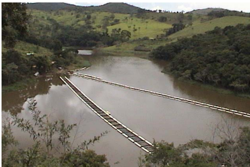
Figura 9: Sistemas de tanques-rede e água doce

A produção em tanques-rede consiste no cultivo de peixes em gaiolas numa grande coleção de água o que possibilita uma eficiente troca de água e remoção dos dejetos (Fig.9 e 10).