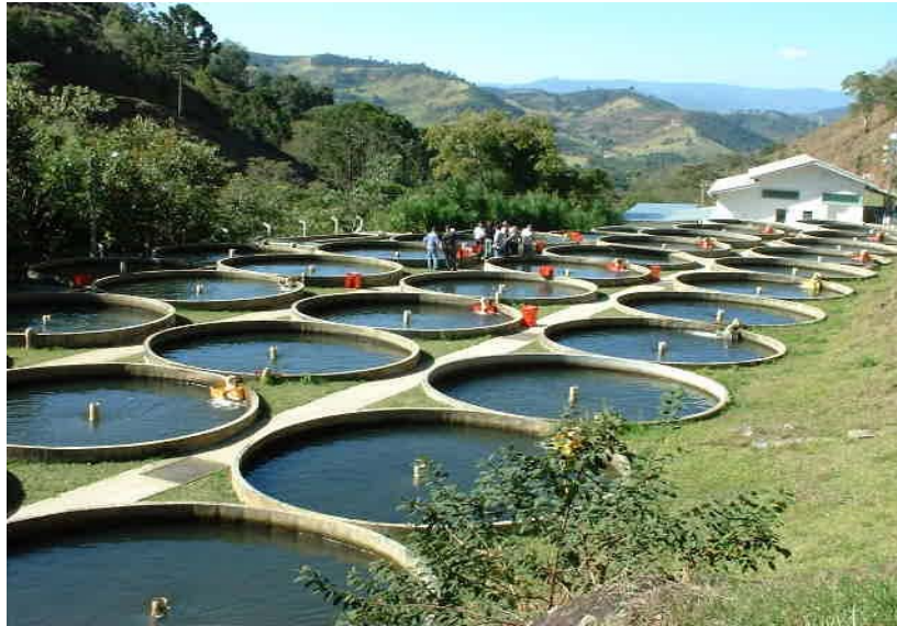
Figura 12: Sistemas de fluxo contínuo ( Raceway ) em tanques circulares.

água pode ser reutilizada após tratamento e bombeamento, mas tal sistema pode se tornar inviável devido aos altos custos com energia (Avault, 1996).