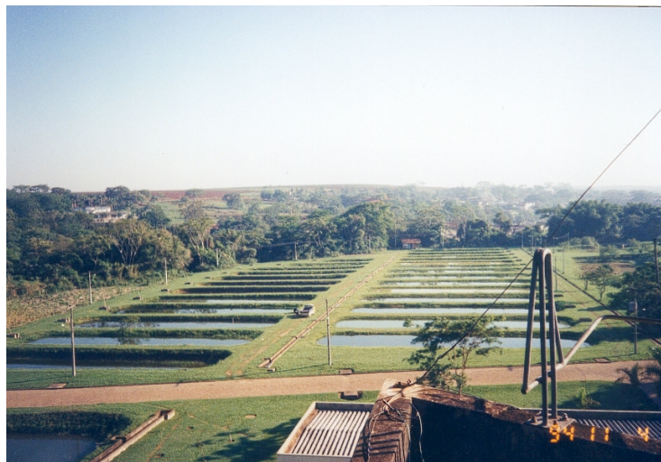
Figura1: Sistema de produção em viveiros

O cultivo de peixes em viveiro é o sistema produtivo mais antigo na aquicultura. Os viveiros são áreas escavadas sem qualquer revestimento interno, preenchidos com água (Fig.1).