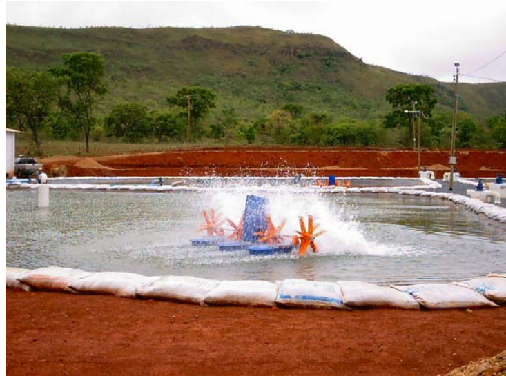
Figura 2: Sistema de produção em viveiros com aeradores

controle da entrada e saída da água, retirada eficaz dos dejetos, programa nutricional adequado e controle da qualidade da água.