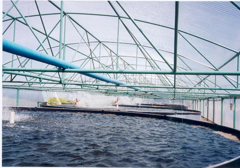
Figura 4: Tanques circulares dentro de estufa em sistema de recirculação de água

Outra vantagem do sistema de recirculação é o de poder ser instalado em locais com pouca água superficial, em áreas muito valorizadas, como nas proximidades de regiões metropolitanas, ou seja, muito próximas a centros consumidores. Além disso, a utilização de estufas (Fig.4) e/ou galpões permite, ainda, a criação de espécies tropicais em regiões de temperaturas mais amenas, evitando, assim, a falta de regularidade de fornecimento e o prolongamento do ciclo produtivo.