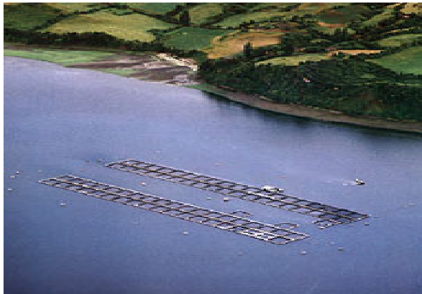
Figura 10: Sistemas de tanques-rede no mar

Os tanques são construídos em uma variedade de formas e materiais, tais como ferro, pvc e nylon e outros materiais sintéticos. As estruturas de suporte podem manter os tanques na superfície ou abaixo dela (Introduction..., 1999; Beveridge, 1996). Eles variam em tamanho de um a centenas de metros cúbicos e podem ter qualquer formato, tendo as formas quadrada, retangular ou cilíndrica como as mais típicas (Introduction..., 1999). Beveridge (1996) cita a existência de quatro tipos básicos de tanques-rede: fixos, flutuantes, submersíveis e submersos.