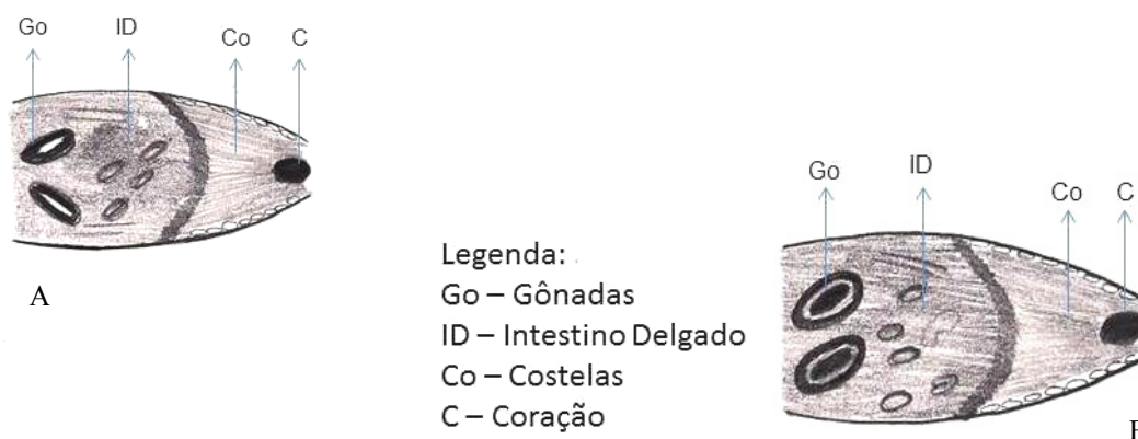
Figura 2 – Sexagem pela gônada fetal do equino. A) Macho (evidenciando o testículo com o mediastino); B) Fêmea (evidenciando os ovários – cortical e medular).

As gônadas fetais são estruturas ovais com dois a sete centímetros de comprimento, dependendo do período da gestação, e com ecogenicidade semelhante ao fígado fetal. Nos machos, possui uma aparência homogênea, com uma linha fina central e longitudinal ecogênica (representa o mediastino), pouco visível após os 125 dias de gestação. Quando em identificação frontal, as gônadas situam-se nas partes caudal e ventral do abdômen, entre os membros pélvicos. Nas fêmeas, a gônada possui no seu interior a presença de uma estrutura ecogênica circular que é circundada por um halo hipoeocogênico central (representando a região cortical e a medular). Seu tamanho e localização são similares às gônadas do macho (Renaudin et al., 1997; Fig. 2).